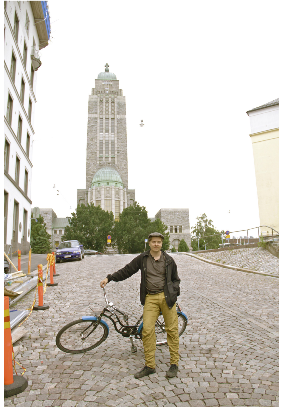
Pussikaljaelokuvan julistetta mukaillen: Ritalla ja vaihteeton fillari.

- Se joka tekee tälle asialle jotain, saa ääneni kunnallisvaaleissa.