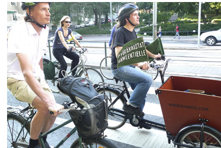
Kriittinen pyöräretki vaatii pyöräkaistoja Hämeentielle. KUVA Otso Kivekäs

Polkaisen liikkeelle Kurvissa. Taksi kiilaa vasemmalta ohi, vain kääntyäkseen heti oikealle Hesarille. Liian läheltä tietenkäin.